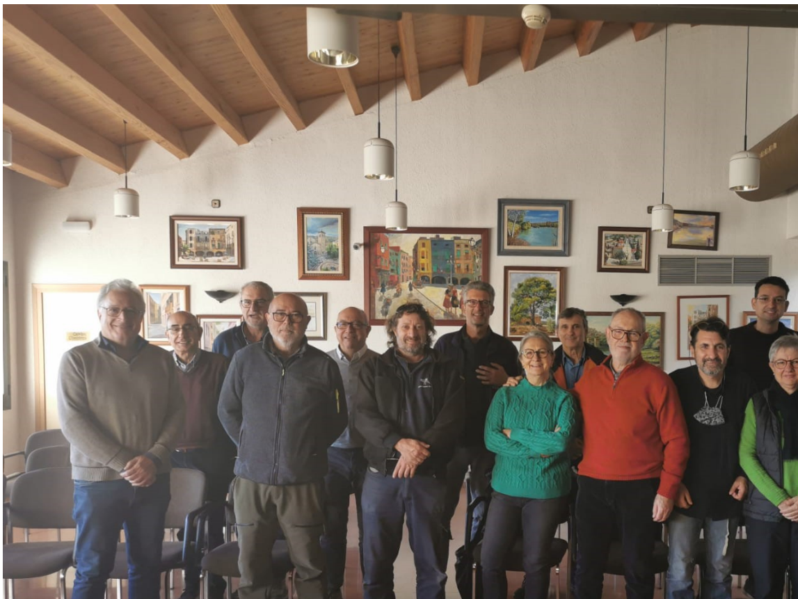
FOTO DE LA CONSTITUCIÓ DE SOLFLIX, SCCL A LA SALA DE PLENS DE L'AJUNTAMENT DE FLIX